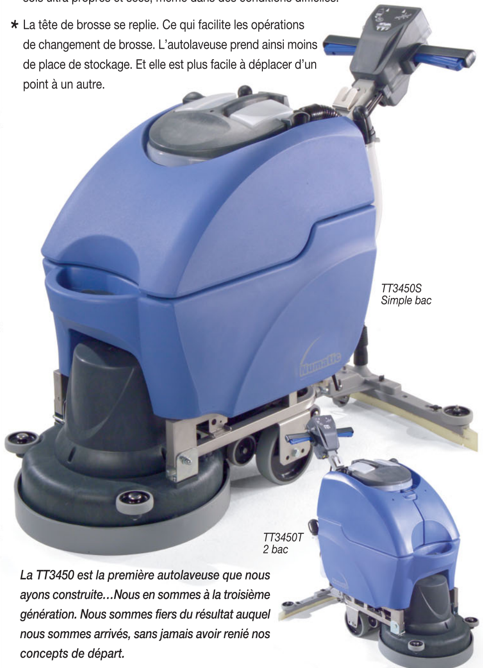
TT3450S Simple bac