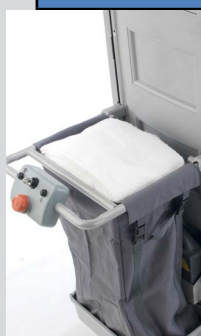
Sur version HF - bacs de rangements avec couvercles sur le dessus