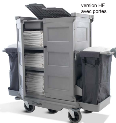
version HF avec portes