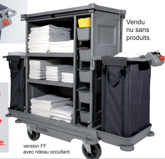
Vendu nu sans produits.