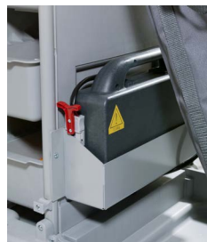
Chariot motorisé avec valisette batterie